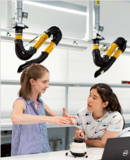
Die Fachschule für Technik ist eine Schulart der Gewerbeschule Bühl. Die Gewerbeschule Bühl ist ein Bildungszentrum des Landkreises Rastatt.